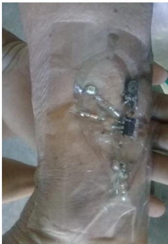
Figura 5. Dispositivo electrónico

Los datos sobre la presión sanguínea son tomados automáticamente a través de un dispositivo electrónico (Figura 5), del cual serán enviados a la aplicación, los procesará para posteriormente generarle un mensaje al usuario sobre el resultado. Si la presión arterial está por encima de los valores establecidos como normales, se le indicará al adulto mayor que acuda a su médico lo más pronto posible, así como también se le notificará al familiar y al médico enviándoles una alerta para la pronta atención del usuario.