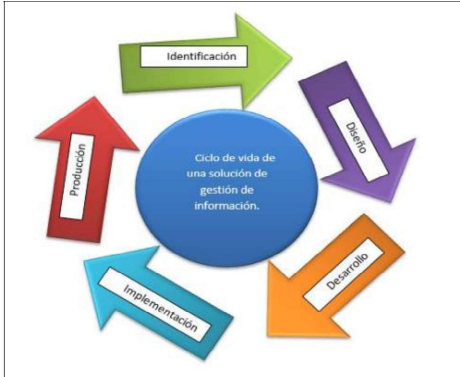
Figura 1.-Metodología del desarrollo de la propuesta.

La metodología se encuentra enmarcada en cinco fases como se muestra en la figura 1, denominadas: identificación, diseño, desarrollo, implementación y producción. A continuación se describe cada una de las actividades que intervienen en el desarrollo de la propuesta.